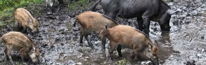
LE VAUTREMENT ENDOMMAGE LE SOL FORESTIER.